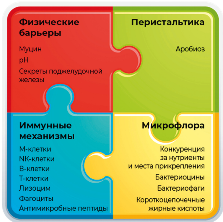
Рис. 1. Защитные механизмы желудочно-кишечного тракта птицы

ствием в обеспечении иммунитета (рис. 1) [3].